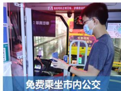
免费乘坐市内公交

（四）创新创业服务。 人才可享受科研经费扶持、创业场地支持、项目金融支持和法律咨询服务等创新创业服务。比如，“荷城英才”法律顾问团可为人才提供涵盖公司类、行政类、金融类、劳动类等7个大类的法律咨询服务。