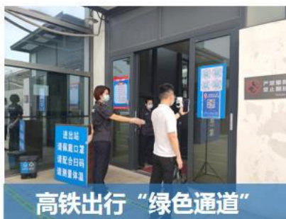
高铁出行“绿色通道”