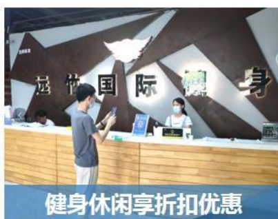
健身休闲享折扣优惠