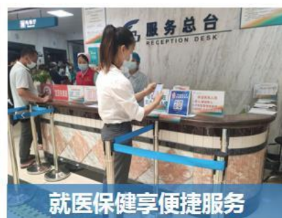
就医保健享便捷服务